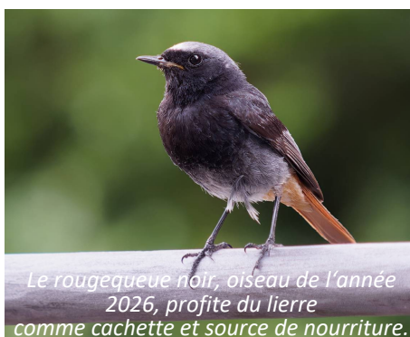
Le rougequeue noir, oiseau de l'année 2026, profite du lierre comme cachette et source de nourriture.

Conseil : pour la laine et la soie, utilisez uniquement du détergent au lierre frais et pur. La soude ne convient pas aux fibres animales, car elle les fait gonfler.